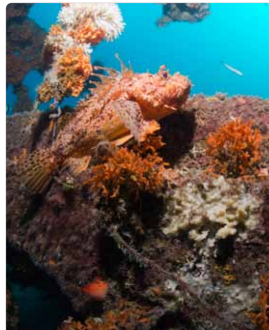
Grand prix national du génie écologique (2014) - "Opération récifs Prado" - Marseille