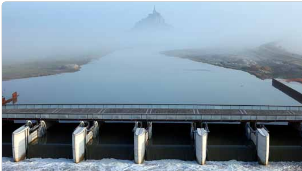
Grand prix de l'ingénierie française (2010) pour le barrage de la caserne sur le Couesnon - Programme de rétablissement du caractère maritime du Mont St Michel